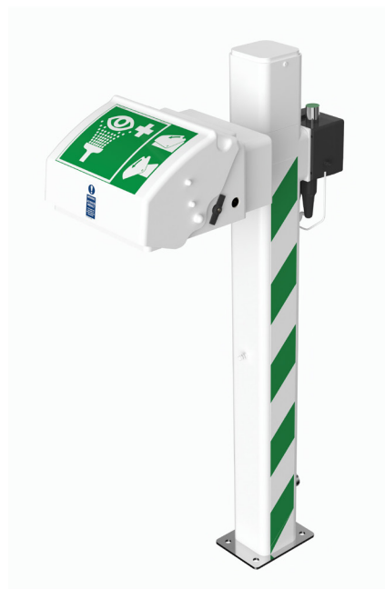
Abbildung mit optionalem Fußhebel

Um zu verhindern, dass das Wasser in den Rohrleitungen der sockelmontierten Augen-/Gesichtsdusche bei kaltem Wetter einfriert, verfügt diese Vorrichtung über eine Begleitheizung und eine Polyurethanschaum-Isolierung. Durch die integrierte Abdeckung sind das Auffangbecken und die Strahlregler vor Staub und Schmutz geschützt. Die Vorrichtung ist sowohl für den Einsatz in explosionsgefährdeten (ATEX Zone 1 & 2) als auch in nicht explosionsgefährdeten Bereichen geeignet. Sie liefert 12 Liter Wasser pro Minute und ermöglicht so ein effektives und gründliches Ausspülen der Augen. Die Vorrichtung ist nach EN- und ANSI-Normen ausgelegt.